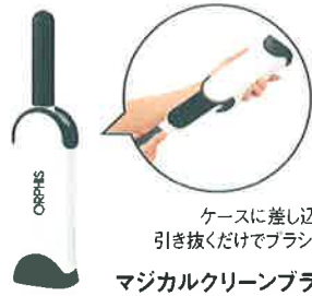
マジカルクリーンブラシ

※1社様につき一点となります。※数に限りがあるため、ご希望に添えない場合がございます。また、記念品の内容が変わる場合がございます。