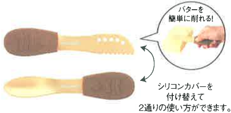
アイスクリームスプーン&バターナイフ

ご来場の記念に下記の中からご希望の品をおひとつプレゼントいたします。 下記の「ご来場予約申込書」に必要事項をご記入のうえ、FAXにてご返信ください。